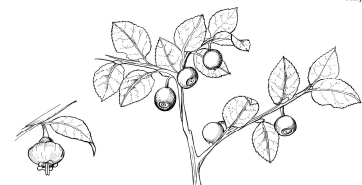
Mirtillo nero ( Vaccinium myrtillus )