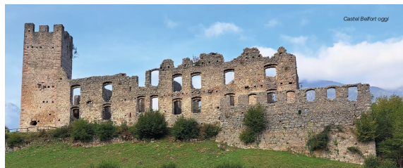
Castel Belfort oggi